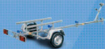
N300 - remorque - port scooter de mer