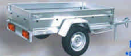
BA6116U *BB6116U BA6116UBW *BB6116UBW