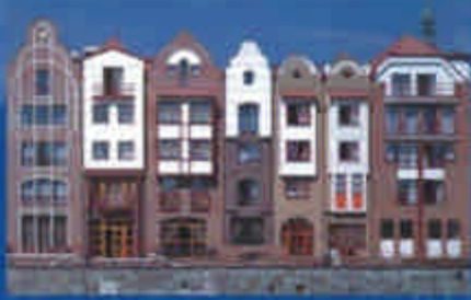
matériaux de construction