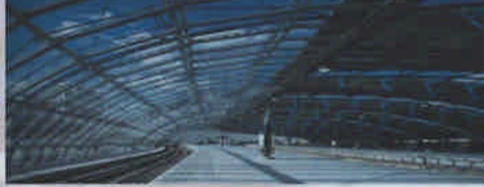
expédition et transport